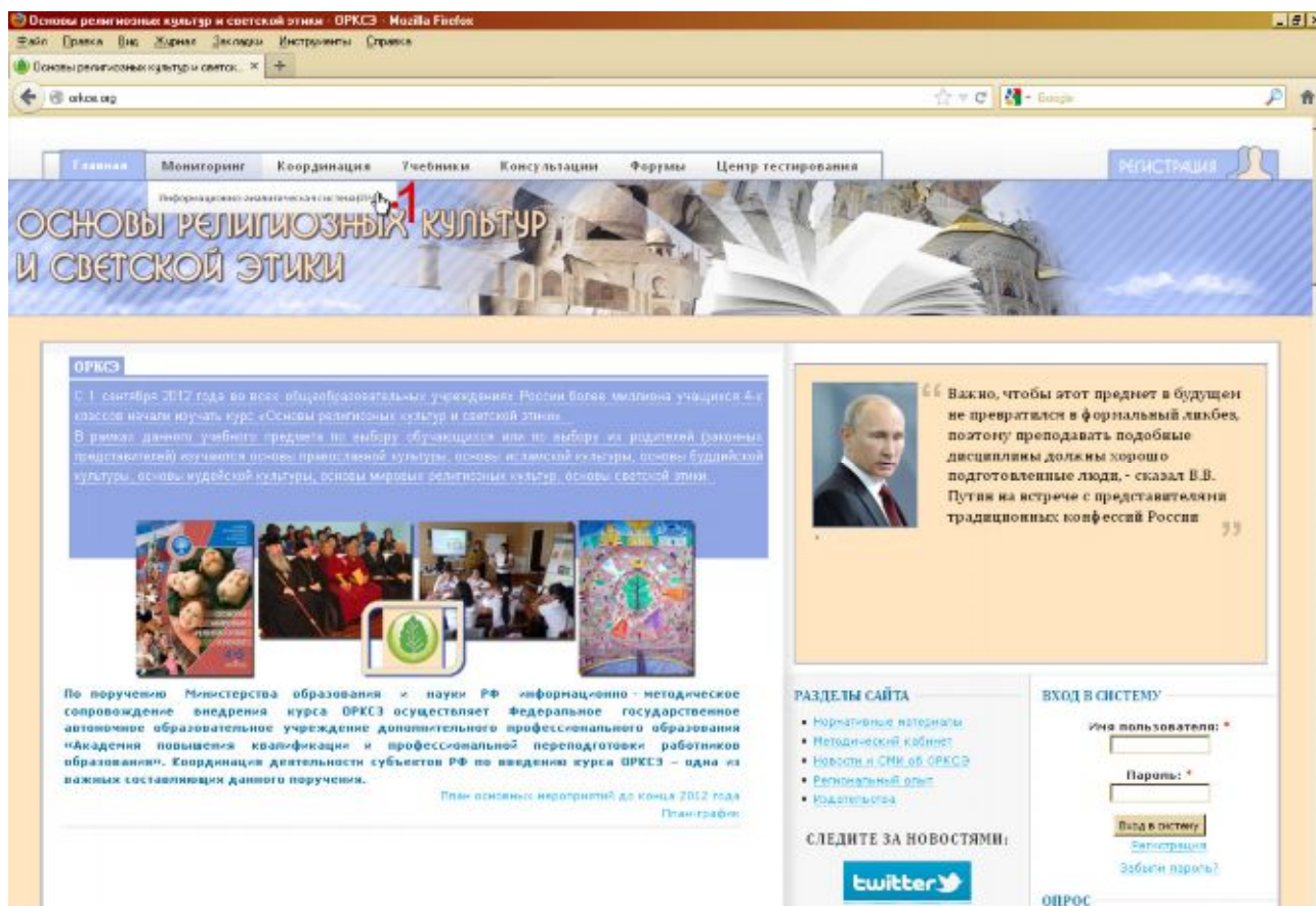
Рис. 1. Вход в ИАС ОРКСЭ через портал ОРКСЭ

Открытие специального ресурса ИАС ОРКСЭ осуществляется через портал ОРКСЭ. Для этого нужно, используя любой персональный компьютер с выходом в Интернет, в браузере, в строке адреса набрать ресурс портала ОРКСЭ http://orkce.org , нажать Enter. Далее перейти по ссылке главного меню «Мониторинг/Информационно-аналитическая система (ИАС)» (рис. 1 [1]):